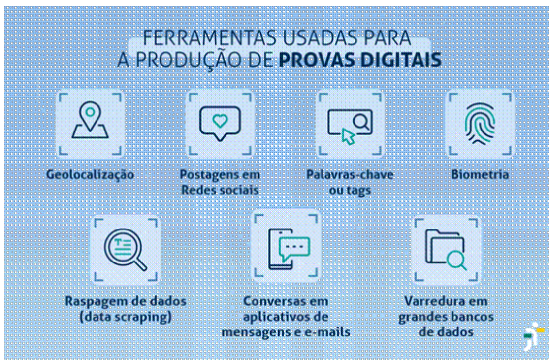
Figura 01: Ferramentas usadas para a produção de provas digitais

Por sua vez, a doutrina identifica, e organiza os tipos de provas existentes, bem como suas classificações. Para uma melhor compreensão se faz necessário o entendimento de como estas provas serão inseridas dentro do processo penal, faz-se a distinção entre meios de provas, e fontes de provas. As fontes de prova são pessoas ou coisas das quais se obtém a prova, podendo ser pessoais ou reais, e possibilitam o esclarecimento da existência do fato delituoso. Os meios de prova, por sua vez, são instrumentos essenciais pelos quais se apresentam ao juiz os elementos probatórios, com o objetivo de fixar os dados no processo. (Grinover; Gomes Filho; Scarance, 2011).