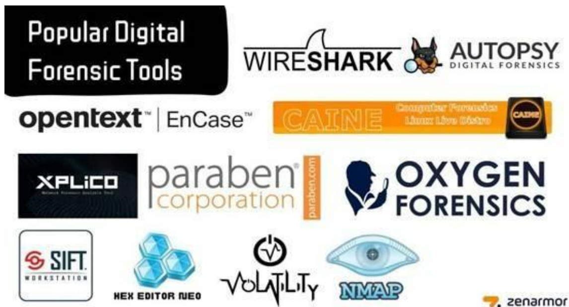
Figura 02: Ferramentas usadas em perícia digital.

de ferramentas de computação essenciais que garantam a integridade e rastreabilidade, autenticidade e preservação.