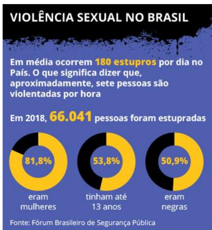
Figura 01: Violência sexual no Brasil (2018)

Arte: Thiago Fagundes/Agência Câmara Data: 01/10/2020