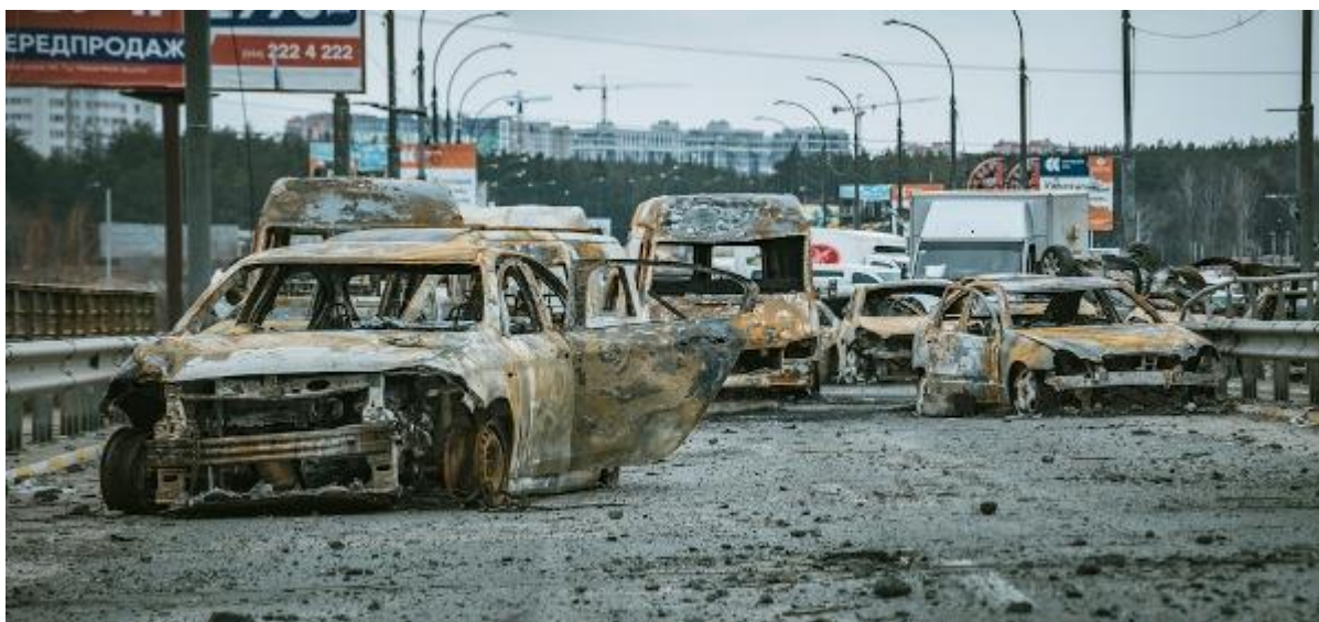
Figura 2 - Destruição registrada na via que conecta as cidades de Irpin e Bucha, próximo a Kyiv, na Guerra entre Rússia e Ucrânia