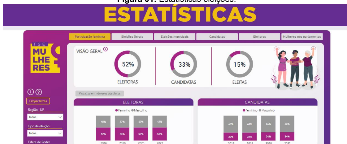
Figura 01: Estatísticas eleições.